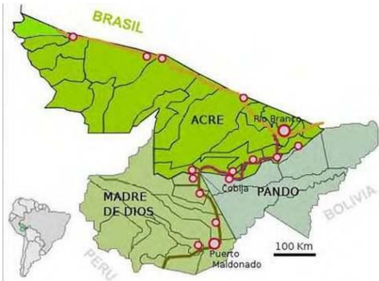
Fig. 3 - Mapa da ABCI para a região Madre de Dios-Acre-Pando (MAP).