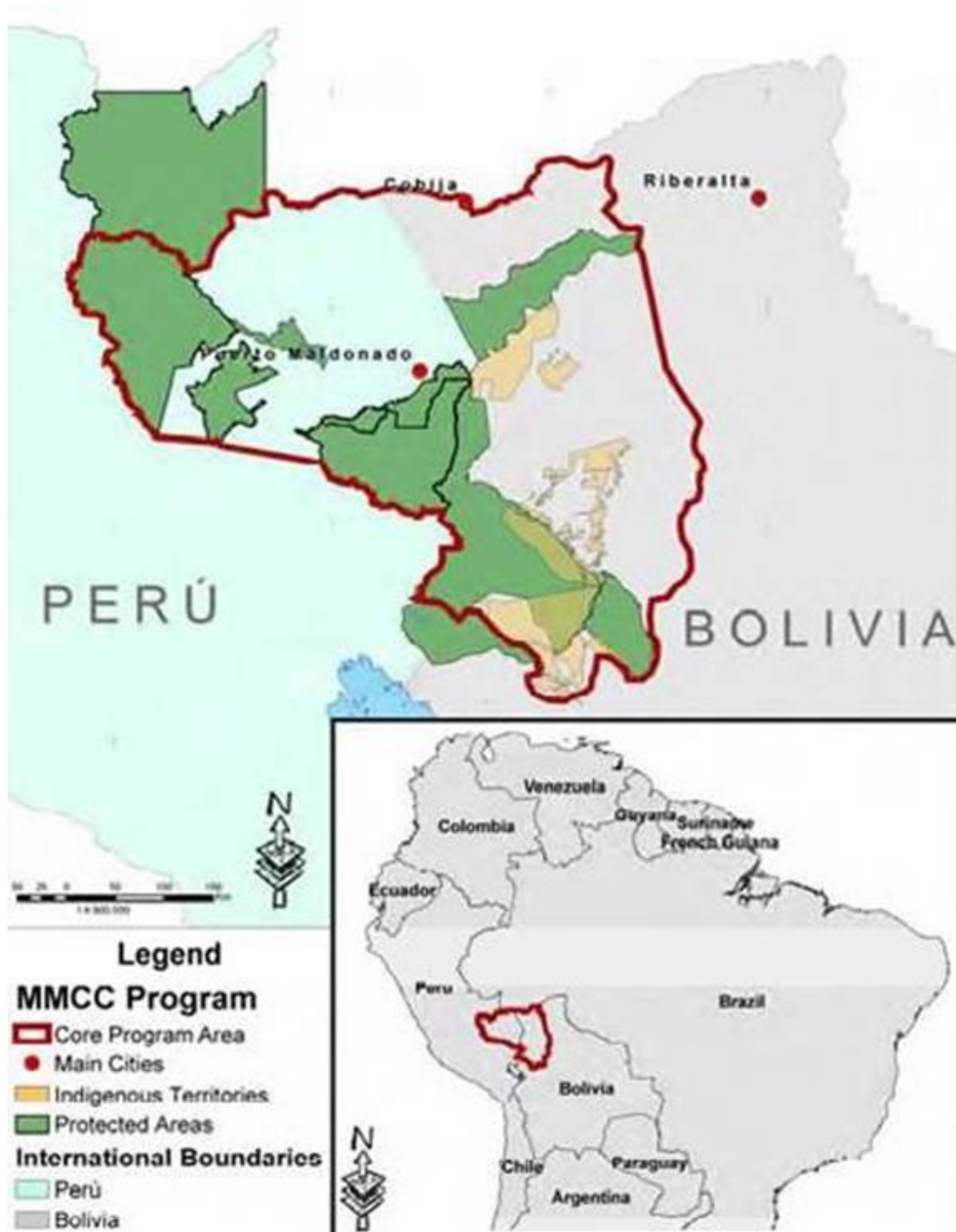
Fig. 2 - Mapa da ABCI para a área Madidi-Manu.